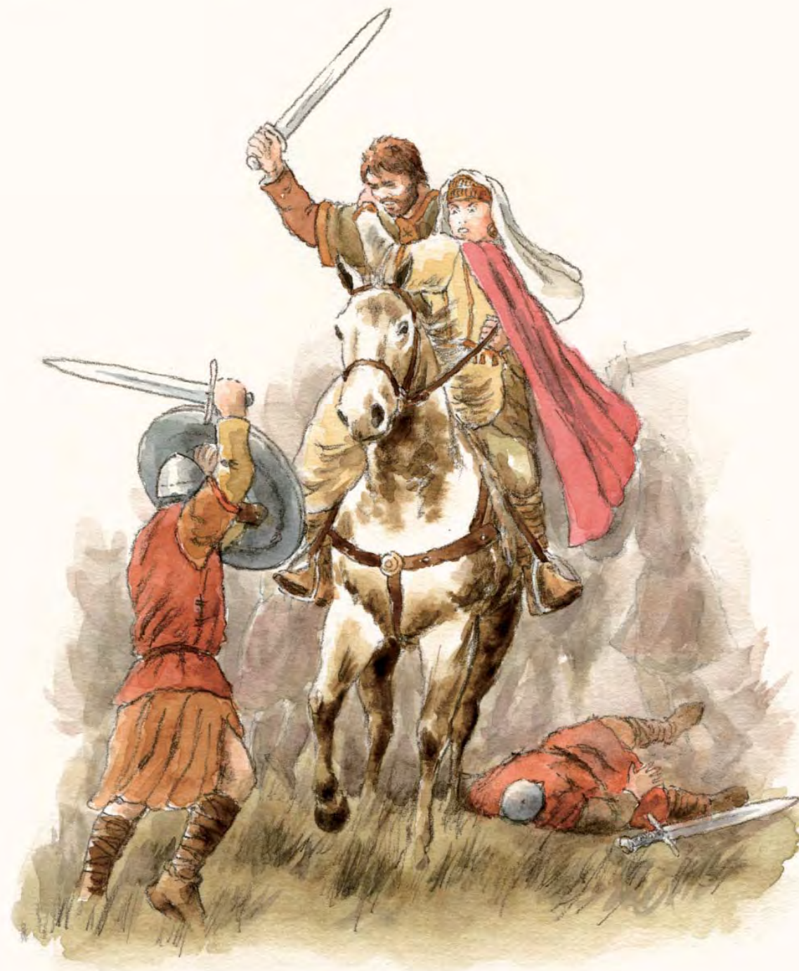
Svatopluk a Svatozizňa

Podobný osud čekal i na arcibiskupa Metoděje. Pravděpodobně na zpáteční cestě z Říma byl na příkaz franského biskupa nečekaně zajat a uvržen do chladného vězení, kde měl zůstat na doživotí. Nenáviděný zastávce slovanské bohoslužby byl pokořen a franští duchovní si mnuli ruce.