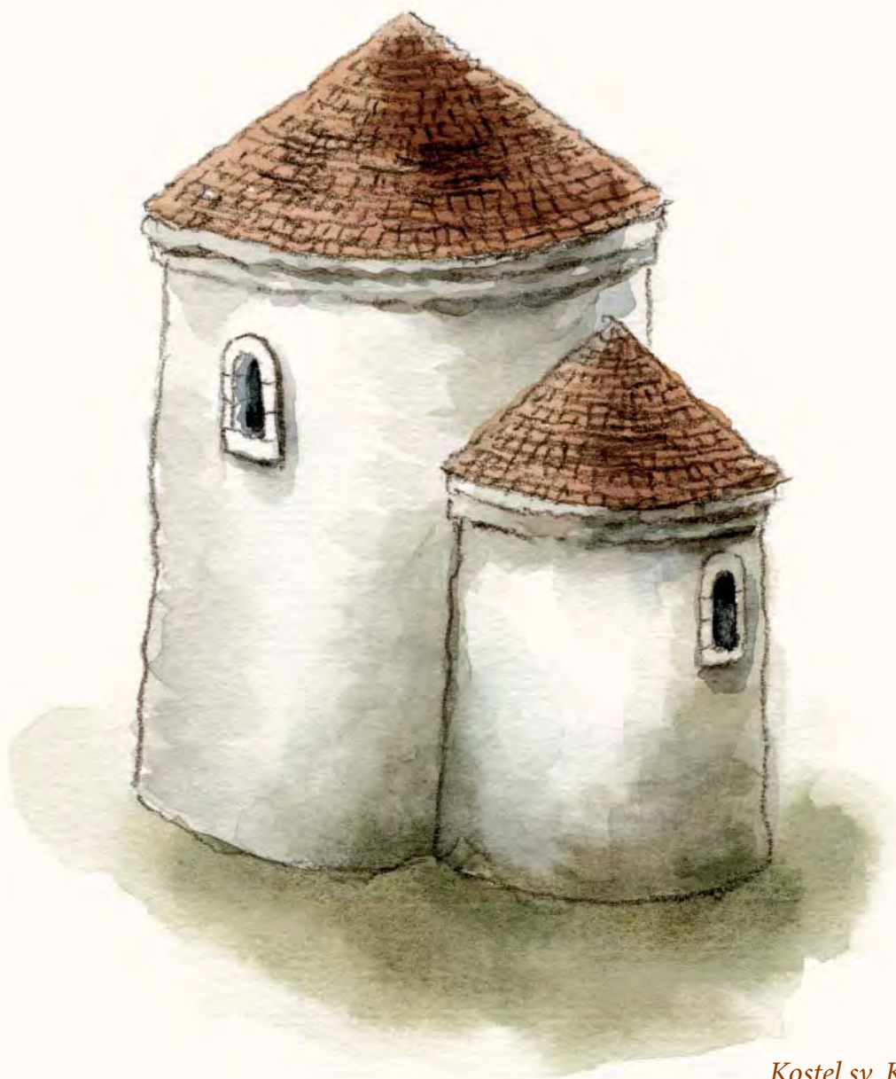
Kostel sv. Klimenta