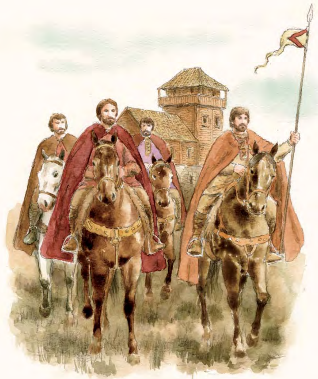
Bořivoj z družinou odjíždí ze Svatoplukova sídla

Bořivoj se udiveně otočil a spatřil nezvykle oděného asi šedesátiletého starce. Svatopluk, předem obeznámen s plánem, vysvětloval. „To je biskup Metoděj a pravda, pro tebe a tvou družinu je vyhrazeno místo tady na rohoži,“ ukázal na podlahu vedle sebe, „my se posadíme ke stolu,“ a bez dalších připomínek se s Metodějem posadili za stůl.