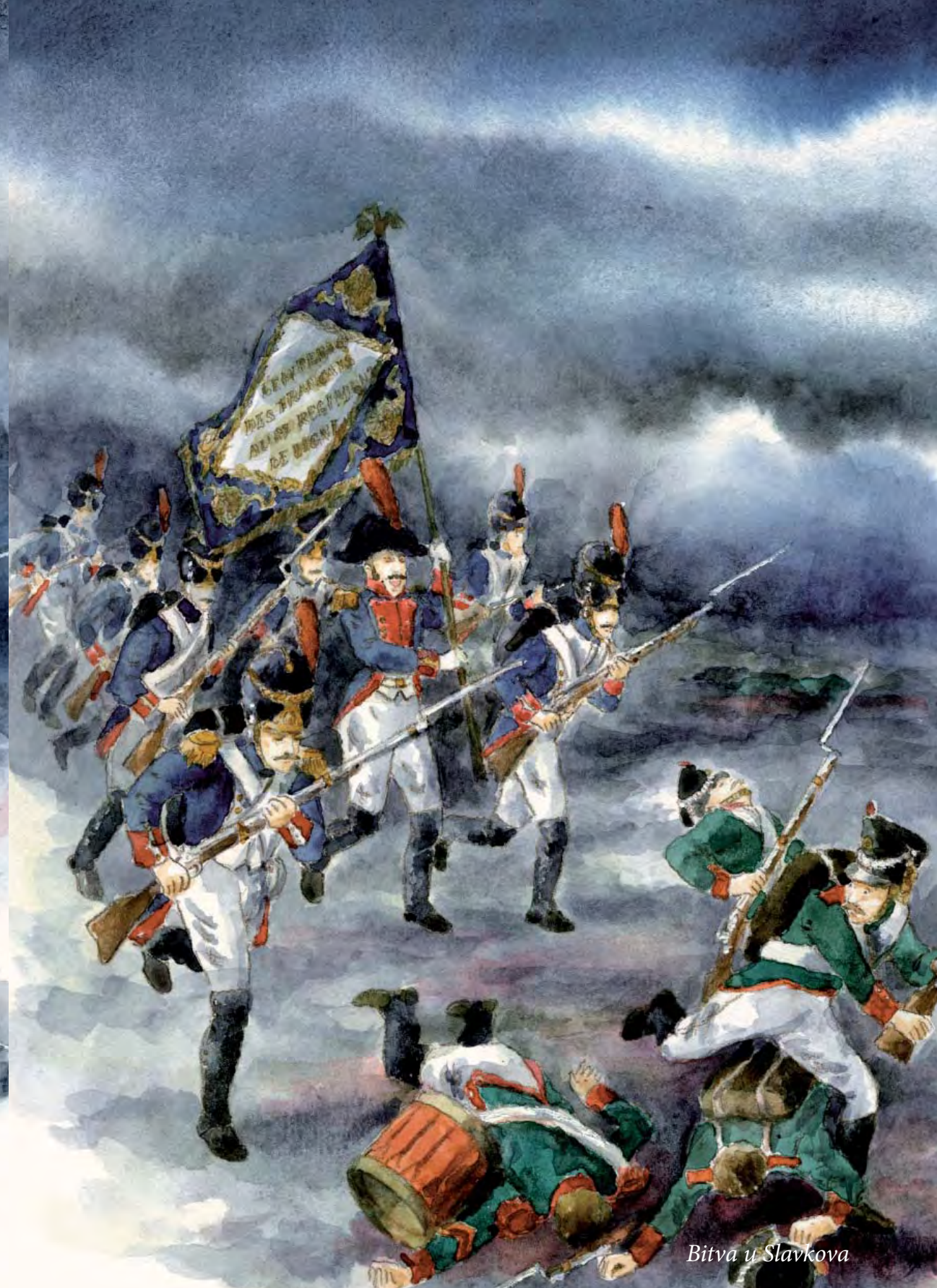
Bitva u Slavkova