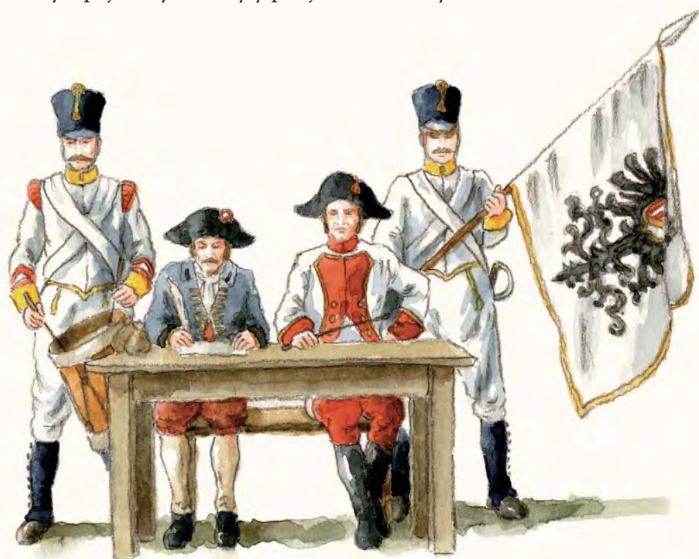
Císařští vojáci pověření odvody chlapců do války

Válečné voje se jako na zběsilé houpačce přesouvaly světadílem a země Koruny české trpěly. Nebylo to poprvé, co si Habsburkové z Čech a Moravy udělali spížírnu potravin, sklad vojenského vybavení, ale také zásobárnu početné lidské síly. Mladí muži byli vytrháváni ze svých rodin, práce a navlékání